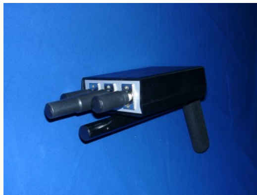
Abbildung 5.1: Montage und Anschluss der Sonden

In Abbildung 5.1 sehen Sie, wie die 3 Sonden am Gerät angesteckt werden. Die große Sonde muss dabei in der Mitte und die beiden kleinen Sonden jeweils an den Seiten angesteckt werden. Verzichten Sie dabei auf unnötige Kraftanwendung!