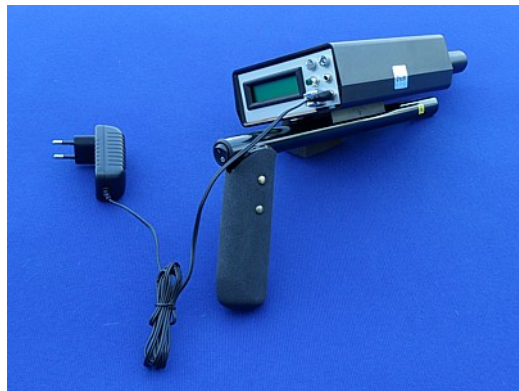
Abbildung 8.2: Anschluss des Ladegeräts

Zum Aufladen des Bionic 01 muss anschließend das mitgelieferte Ladegerät mit dem Ladekabel an die dafür vorgesehene Ladebuchse angeschlossen werden, wie in Abbildung 8.2 dargestellt.