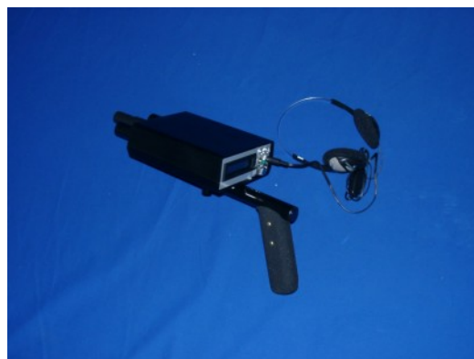
Abbildung 5.2: Anschluss von Ladegerät und Kopfhörer

In Abbildung 5.2 wird gezeigt, wie das mitgelieferte Ladegerät angeschlossen wird und die Kopfhörer mit dem Gerät verbunden werden müssen.