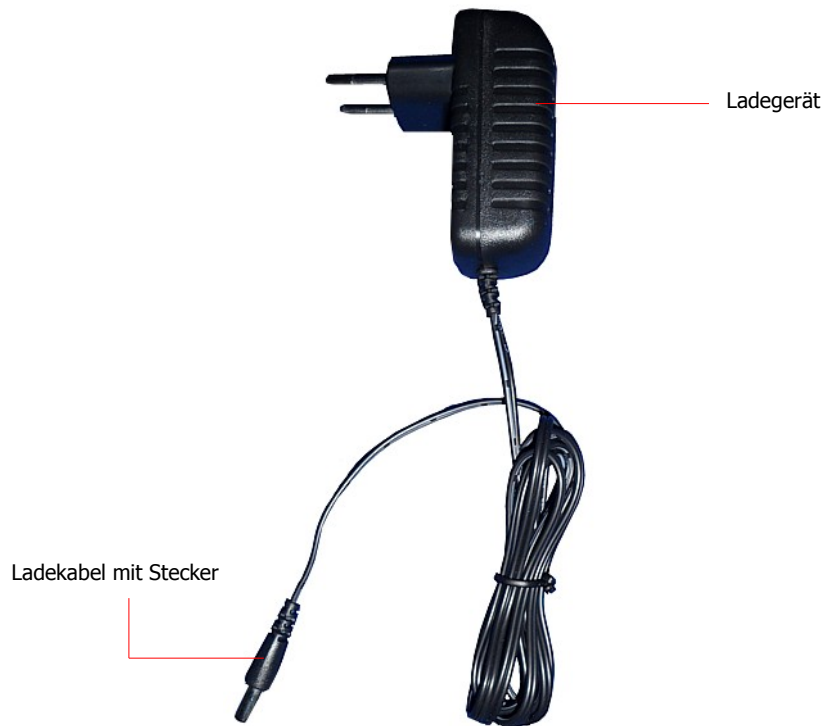
Abbildung 8.1: Das Ladegerät und dessen Elemente

Verwenden Sie zum Aufladen der internen Batterie des Bionic 01 ausschließlich das mitgelieferte Ladegerät!